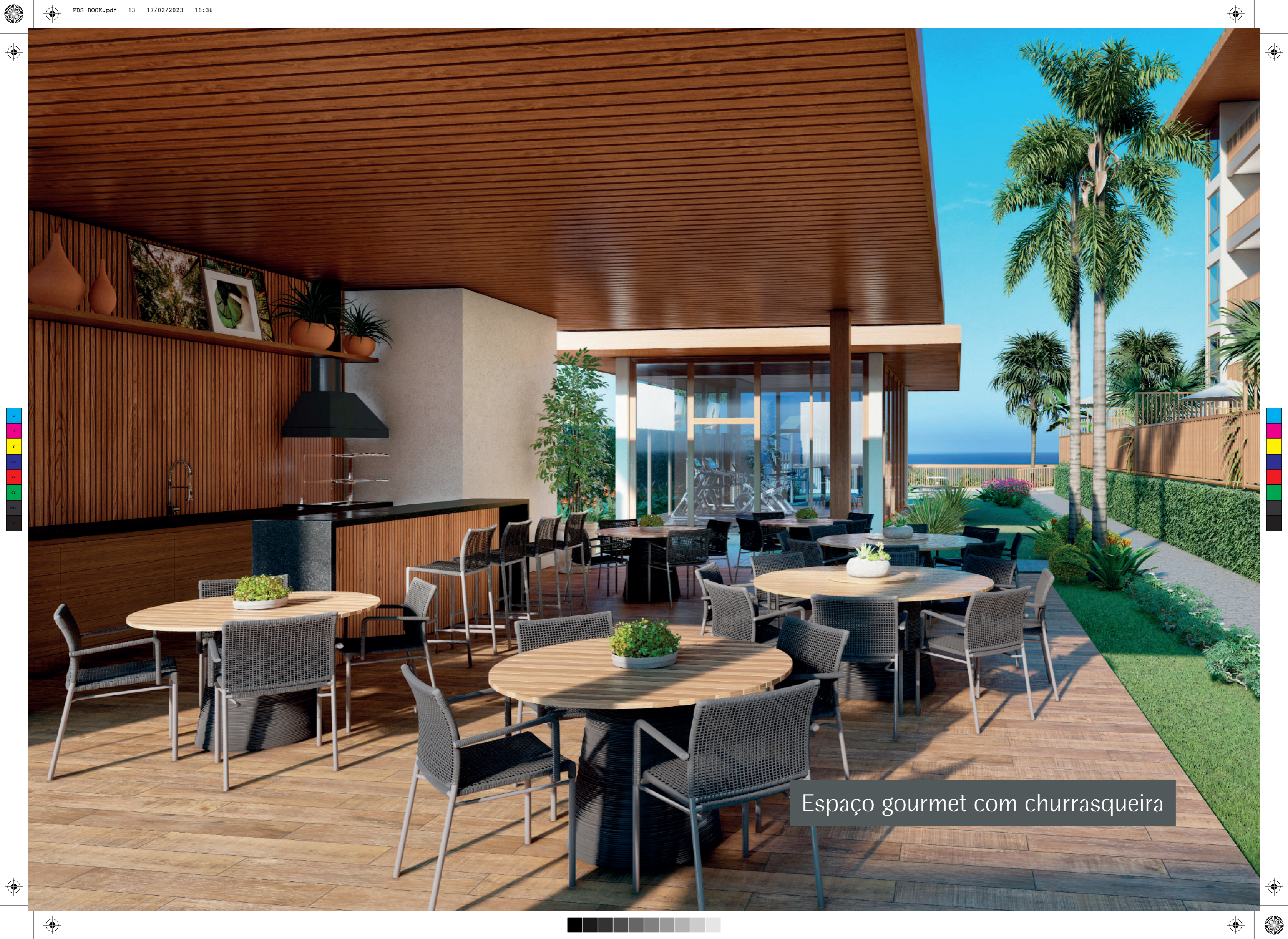
Espaço gourmet com churrasqueira