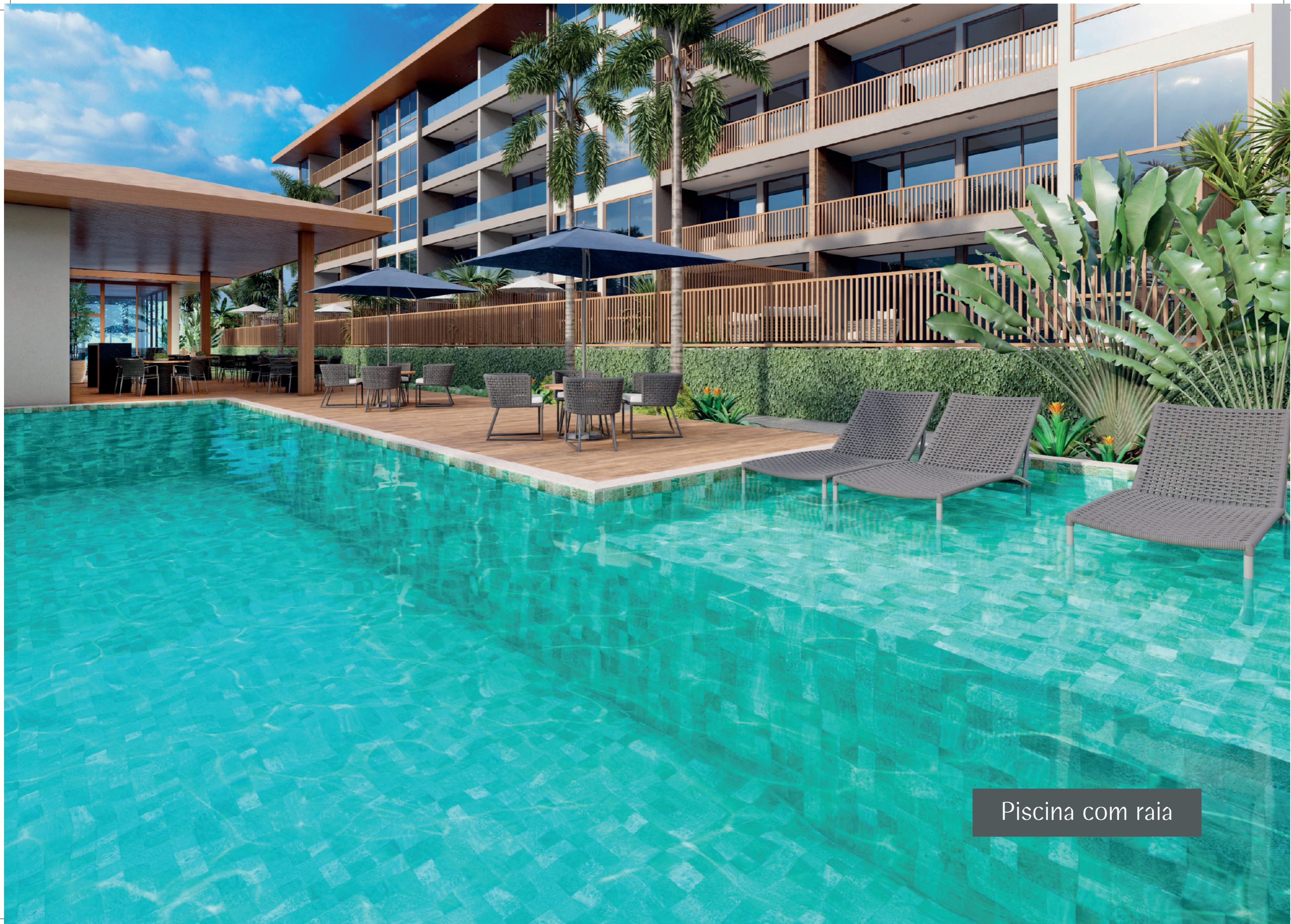
Piscina com raia